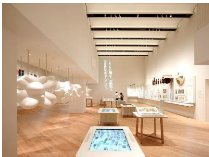
常設展示室 (Hall A)

2002年に開館以来、200万人を超える方々にご来館いただき、広告の社会的・文化的価値への理解を深めていただく活動を行っています。江戸時代から現代まで約30万点の収蔵資料を誇り、ライブラリーでは、広告とマーケティング関連書籍の閲覧、広告作品のデジタルアーカイブを検索・閲覧することができます。