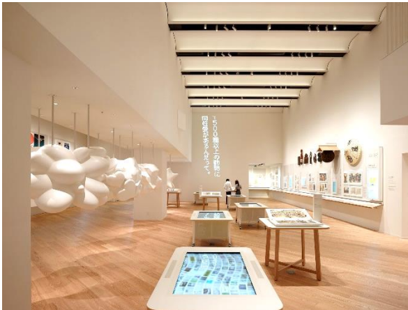
常設展示室 (Hall A)

2002年に開館以来、200万人を超える方々にご来館いただき、広告の社会的・文化的価値への理解を深めていただく活動を行っています。江戸時代から現代まで約30万点の収蔵資料を誇り、ライブラリーでは、広告とマーケティング関連書籍の閲覧、広告作品のデジタルアーカイブを検索・閲覧することができます。